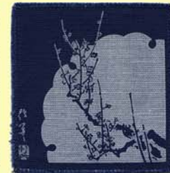
梅花コースター 310円

2004年の百花園開設200年を記念して、この梅の絵を、雪輪の中に復刻して、藍染めのコースターといたしました。