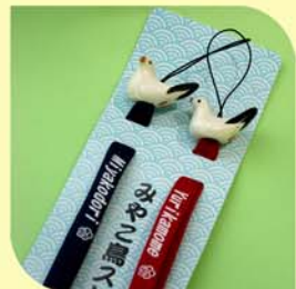
携帯ストラップ 1000円