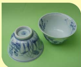
秋の七草湯飲み 1500円