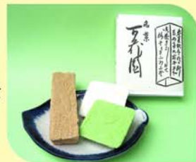
名菓 百花園 180円

この喜びを記念して作られたのが「名菓 百花園」です。素朴な麦、抹茶、南京豆の三種類の味が楽しめ、お月見を描いた「月とススキ」、虫聞きの会で「源氏香鈴虫の巻」、隅田川を象徴する「都鳥」を図柄としております。